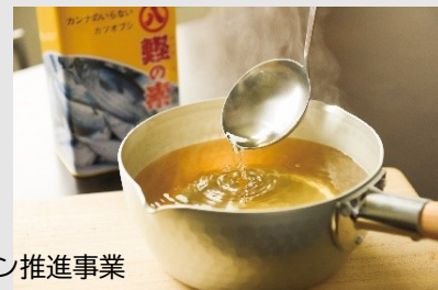
静岡県立大学健康食イノベーション推進事業